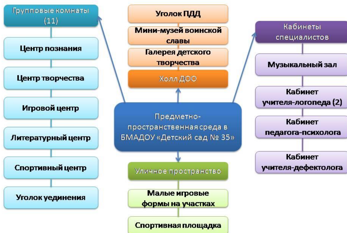
Рисунок 1. Предметно-пространственная среда БМАДОУ «Детский сад № 35»